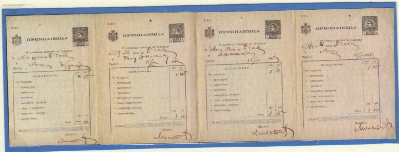
1887. Telegram receipt form strip of four used from Belgrade temporary post office Sava to 1. Nish 2. Bela Palanka 3. Knjazevac 4. Nish